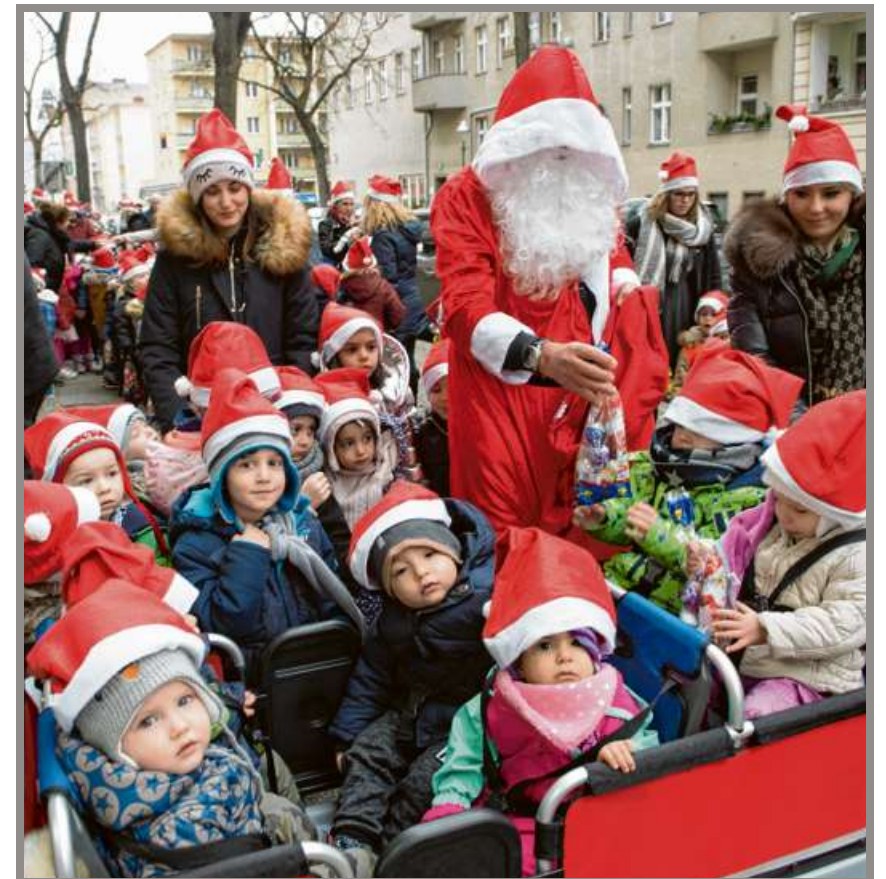
Nikolaustag Ein großes Hallo gab es am 6. Dezember beim Medienpoint in Tempelhof: Der Kieztreff an der Weserstraße ist eine Anlaufstelle für die Nachbarschaft, bei der man kostenlos Bücher bekommt und Feste für Groß und Klein veranstaltet werden. Am Nikolaustag kamen 400 Kinder aus den umliegenden Kitas und wurden durch Spenden auch von „Berliner helfen“ mit Obst und Süßigkeiten beschenkt SERGEJ GLANZE

Wenn Sie noch spenden möchten: Berliner helfen e.V. Stichwort: Bescherung IBAN: DE69 1002 0500 0003 3071 00 BIC: BFSWDE33BER Für eine Zuwendungsbestätigung bitte die Anschrift angeben.