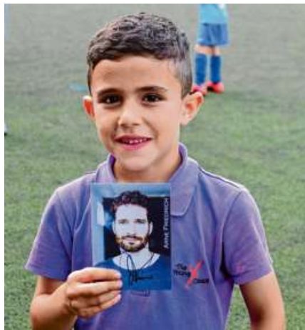
Ahmad (8) zeigt stolz sein Autogramm von Arne Friedrich STIFTUNG JONA

In Jona's Haus ist eigentlich immer was los: an jedem Tag der Woche gibt es Kurse und Workshops um zu Musizieren, zum Backen oder Kochen, Malen, um Sprachen zu lernen oder Ballspiele, um sich im Garten hinter dem ehemaligen Schulhaus in Staaken auszutoben. Doch an diesem Wochenende vor Beginn der Fußball-Weltmeisterschaft steht etwas ganz besonderes auf dem Programm: „Kick it mit Arne Friedrich!“ Mehr als 40 Kinder und Jugendliche, darunter auch Flüchtlingskinder, haben sich auf dem Gelände des SC Staaken an der Eichholzbahn zum Fußball-Training getroffen. Ihr Trainer: Arne Friedrich, Ex-Herthener und ehemaliger Fußball-Nationalspieler. Er hat gleich drei Co-Trainer und einen Schiedsrichter mitgebracht. An verschiedenen Stationen wurde intensiv unter Anleitung der Profis trainiert. Dem elfjährigen Fabian gelingt es sogar, nach einigen Anläufen ein Tor zu